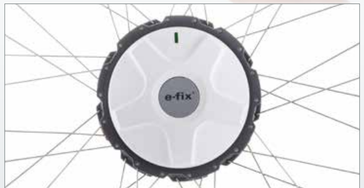
Kompakt, leise, kraftvoll: der e-fix Antrieb