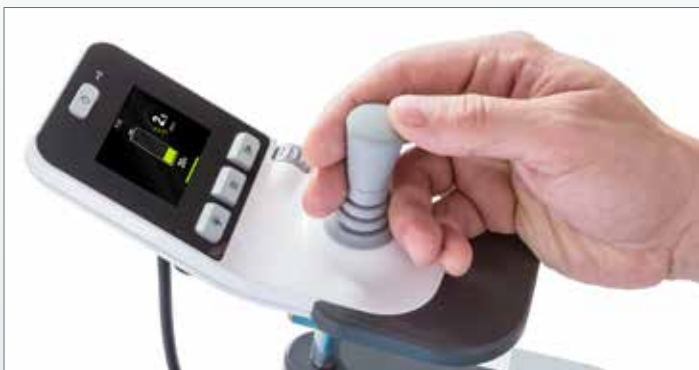
Aussagekräftiges Farbdisplay und benutzerfreundliche Bedienelemente